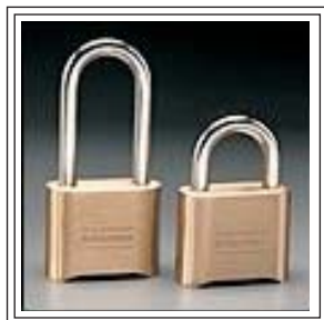
# 175 - 2" # 178 - 2" (Die Cast)

C adenas à combinaison changeable, construit pour résister au vandalisme et à toute attaque physique pour casiers d'employés, d'écoliers et d'entreposage, sacs de sportifs etc.